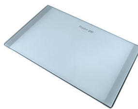
Planche de découpe en verre 8633 300