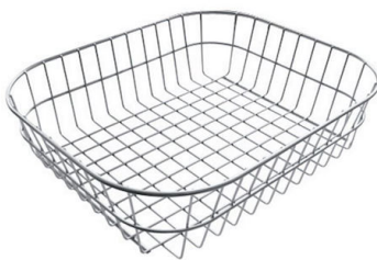
Panier en acier inoxydable 8611 000